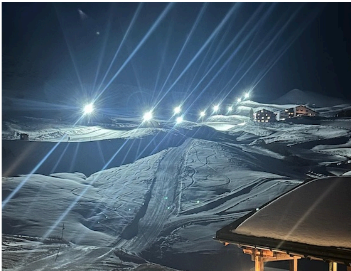
Bild: Skilager, Fideriser Heuberge

Liebe Eltern und Freunde der Primarschule Wolfhausen