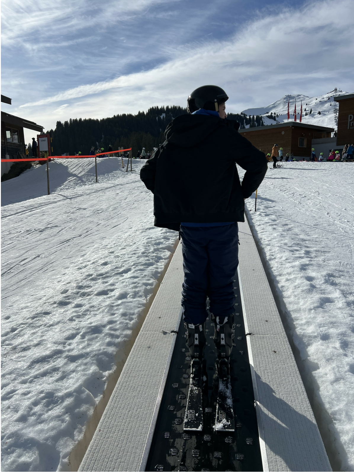
Skilager in den Fiderisen Heubergen